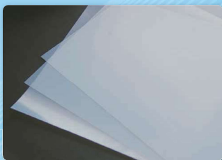
新規転写用メディア外観