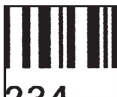
弊社印字サンプル