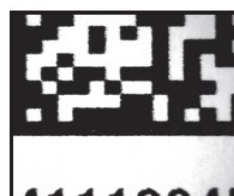
弊社印字サンプル