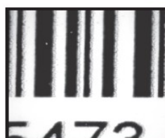
中国市場サンプル